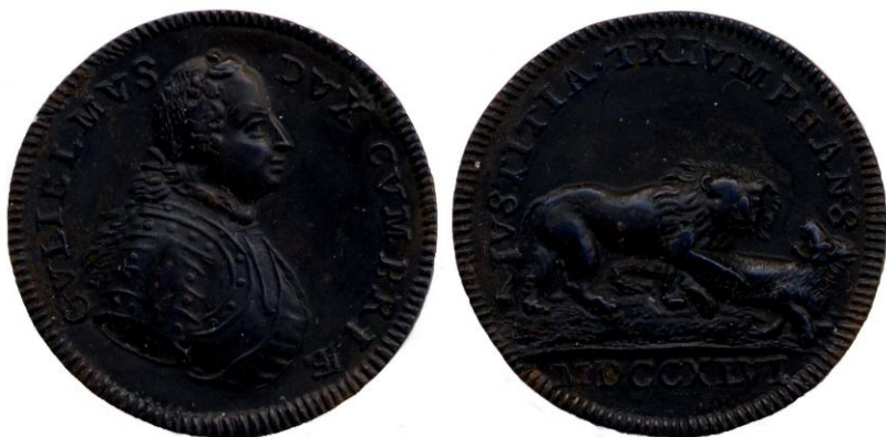
T. Pingo, AE 33 mm

Om in functie van de laatste wet van de Act of Union (de opheffing van de afzonderlijke admiraliteiten van Engeland en Schotland, de vorming van één Office of Admiralty en het ontwapenen van de Highlanders) werd er in 1724 aan Georg Wade gevraagd om toezicht te houden in Schotland en de “glens”. Hij richtte de Highland Watch (de huidige Black Watch) op. Het verlies van hun onafhankelijkheid en de ontwapening was een belangrijk onderwerp bij de Schotse Jacobieten waardoor de onrust in de Highlands steeds toenam.